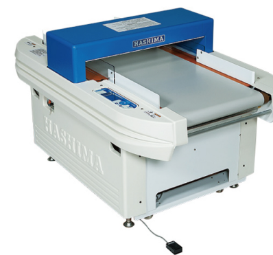
■HASHIMA ベルトコンベア式 HN870C

企画から生産・検品・納品に至るまで国内（自社）にて一貫した情報共有を行っている為、不良率は年間納品数 100 万個に対し 0.1%未満となっております。 検針については HASHIMA ベルトコンベア式検針機を社内に導入し、日本人スタッフによる検針を行っております。