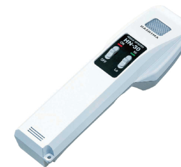
■HASHIMA ハンディ検針機 HN-30